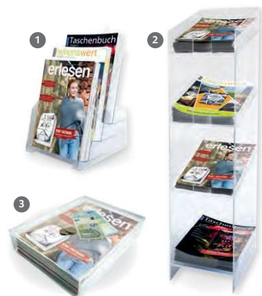
Versand grundsätzlich per Paketdienst. Versandkosten: Bodendisplay 14 €, Thekendisplay/Bezahlteller 5 €